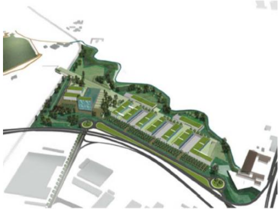
图：中央公园的规划

PTB的解决办法是从地主那儿将Sant-Fruitós土地买过来，他本想在那儿修建住宅中心和酒店。接着将地让渡给由Sant-Fruitós和孟拉萨市政厅共同组成的联合体，为工业园建造城市绿化带。这些谈判是非常棘手的，因为PTB要买的土地本来指定用于住宅用地，而PTB买地的目的却不是为了修建房地产。因此它必须用最低价格购买这块地，才能不损害该项目的整体收益率。PTB与孟拉萨市政厅达成协议，保证该公司能拿到工业园征收房产税95%作为回扣。孟拉萨储蓄银行常务首席执行官Masana回忆说，“我们费尽心思想出这个折衷的办法。但是这也非常难办，因为我们不得不购买本来对于我们来说一钱不值的东西，这只不过是个绿化带。所以我们并不愿意支付房地产价。”他还说，